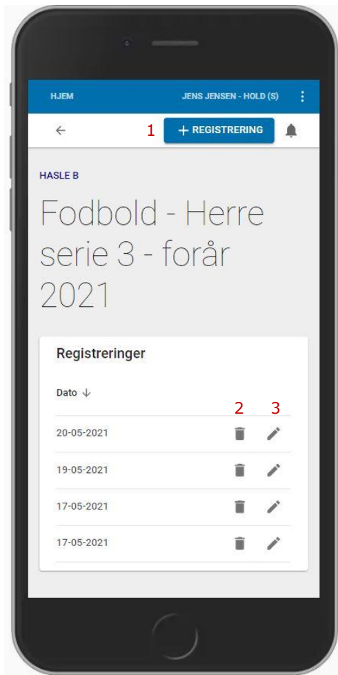
Trænerens/lederens side – visning af et hold